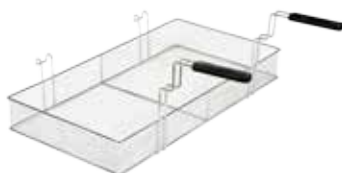
Cestello intero per friggitrici EVO700 da 34 lt