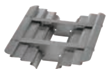
Deflettore olio per friggitrici EVO700 e EVO900