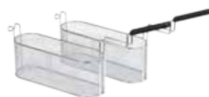
Due mezzi cestelli per friggitrici EVO700 e EVO900 da 14 e 15 lt