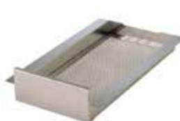
Filtro in acciaio inox per friggitrici EVO700 e EVO900