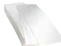
Filtro in carta per filtraggio avanzato per friggitrici EVO900 da 23 lt