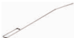
Scovolo per friggitrici EVO700 e EVO900