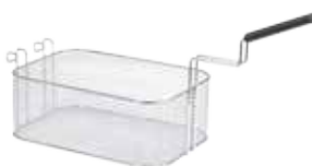
Cestello intero per friggitrici EVO700 e EVO900 da 14 e 15 lt