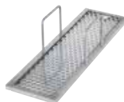
Kit per filtraggio avanzato per friggitrici EVO900 da 23 lt