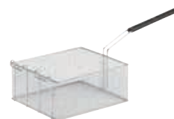
Cestello intero per friggitrici EVO900 da 18 e 23 lt