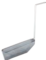
Filtro interno vasca per friggitrici EVO700 e EVO900